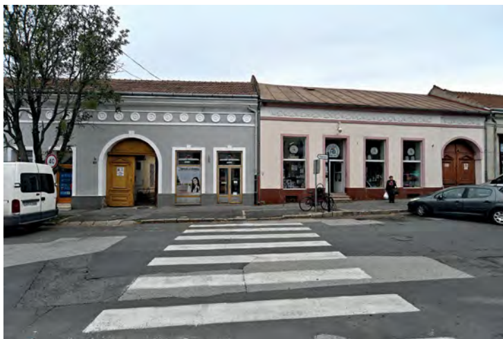
■ A Kossuth utca keleti házsorának részlete a Patika köz torkolatánál. Az eredeti fésűs beépítésű házakat keresztzárnyak emelésével zárt utcai homlokzatúvá építették át, és boltok, vendéglők számára kínáltak alkalmas elhelyezést. A szomszédos épületek egyikében működött az a vendéglő, ahol a főiskolai ifjúság alkalmanként szórakozott, és ahol később az öregdiákok találkozóinak ünnepi ebédeit tartották