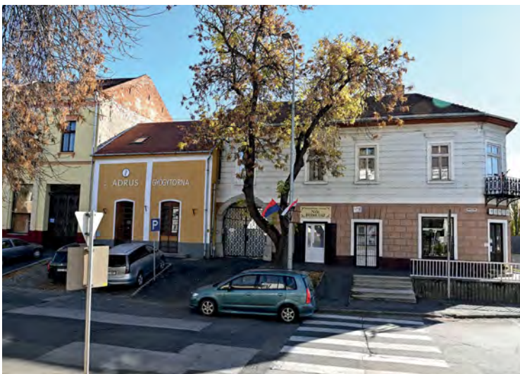
■ A Kossuth utca és a Híd utca sarka. A 19. században kialakított zárt utcai homlokzattal