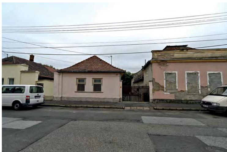
■ A Kossuth utca északi szakaszának részlete. A középkori eredetű fésűs beépítés megmaradt. A bal oldali és jobb oldali házak utcai homlokzatát úgy alakították át, hogy újabb, városiasabbnak vélt, keresztcsárnyas épületekre emlékeztessék az utcán járókat

Sárospatak települési és építészeti adalékait a helyi levéltári forrásanyag nyomán Román