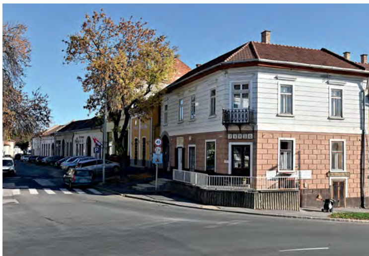
■ A Kossuth utca és a Hid utca találkozásánál a 19. század végére három szomszédos, emeletes házzal hosszabb zárt homlokzatú utcaszakaszt építettek ki az eredeti fésűs beépítésű épületek kiegészítésével. Boltokat, vendéglőt, gyógyszertárat helyeztek el ezen a szakaszon. Az épületek ma is lényegében változatlan funkcióban szolgálják a város lakóit, látogatóit

lárdulásától a város polgárainak érdekei egyre inkább alárendelődtek a földesúri birtok gazdasági érdekeinek. Erre olykor a város tanácsának jegyzőkönyveiben találunk utalásokat. A középkori várost a mezővárosi fejlődés irányába terelték a 17. és a 18. század fejleményei. Ez vezetett oda, hogy Sárospatak az országos hírű tanintézményei, a kétféle akadémiai képzést nyújtó Református Kollégiuma ellenére a dualizmus elején végrehajtott közigazgatási reform során elvesztette városi jogállását, és csak 1968-ban kaphatta vissza.