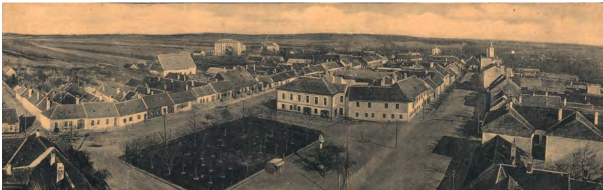
■ Panorámakép Somorjáról. Kranczinger Nándornak a város plébániatemploma (korábban a paulánus szerzetesek temploma) tornyából a középkori eredetű református templom felé délkeleti irányban készített felvétele. Jól látszik a szélső házsor, a Gazda sor zárt vonalú beépítése.