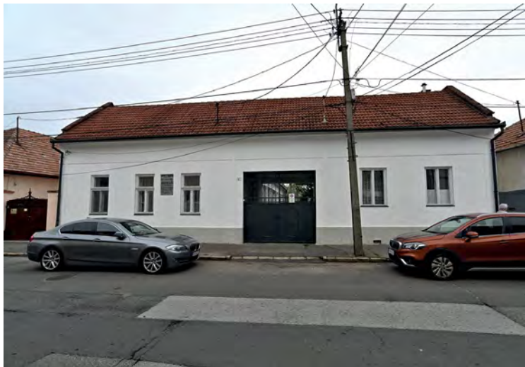
■ A Kossuth utca keleti házsorában álló, a 19. század folyamán L alaprajzúvá átépített, homlokzata közepén szárazbejárásos kapuval, „dufarral” bővített lakóház. Az átalakítás előtti házban lakott Kossuth Lajos, amikor a Sárospataki Református Kollégiumban joghallgató volt. Az emléktábla erre emlékeztet

János, a Tiszáninneni Református Egyházkerület Tudományos Gyűjteményeinek egykori levéltárigazgatója feltárta. 22 Számunkra különös jelentősége van a város történeti térképeinek. A sárospataki uradalom kincstári kezelése idején ismételten készültek térképek. Franz Römisch kamarai geometra 1785-ben készített Mappa regii cameralis oppii Sáros Nagy et Kis Patak térképlapja 23 ad alapot, hogy a Patak városának adózó polgárok otthonait befogadó telkek típusait, beépítésük rendjét elemezzük és összevethessük az 1866-ban felvett birtokvázlat és az 1896-ban szerkesztett újabb kataszteri térkép anyagával. 24 Számunkra bőségesen elegendő, ha a városnak csak a 16. században elkészült, az erődítésen kívüli, a gótikus templom és a Bábagödör vagy másként a Suta-patak mély völgyéig terjedő részét elemezzük. Az orsósan kiszélesedő középkori település-