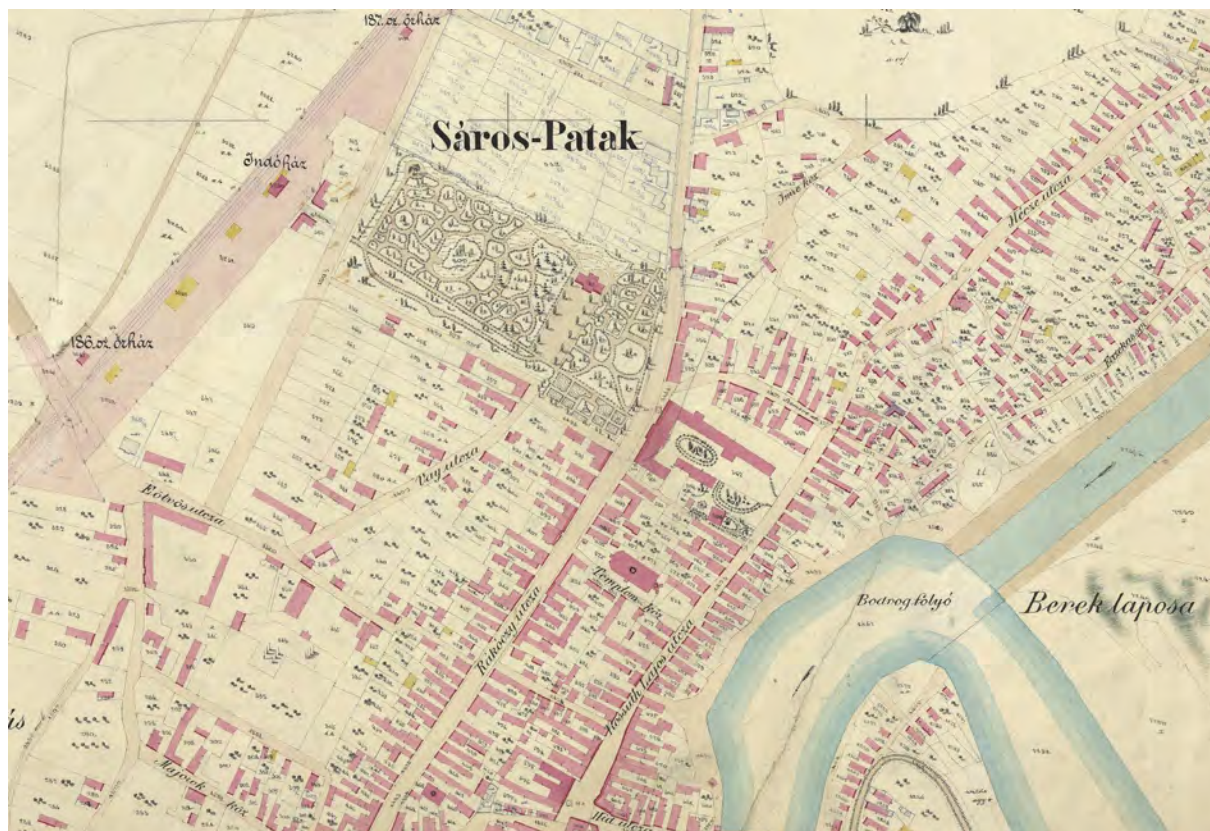
■ Sárospatak belterületének északi része az 1896. évi új kataszteri térképen (LTK)

nyílt. A kapuköz déli oldalán az ötvenes évek végén helyreállított lőréses védőfolyosót tártak fel, állítottak helyre. A kapuköz nyugati oldalát a templom végfala zárta. A templom falában is kőkeretes lőréseket alakítottak ki, ahonnan a kapuközt szintén védőtűz alá vehették. (A kapuköz keleti oldalát még nem tárták fel.)