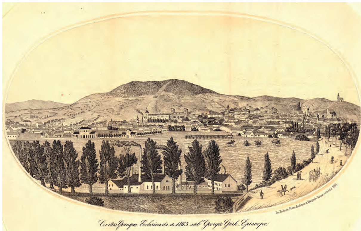
■ Pécs látképe 1863-ban (MNL BaML, XV. 25. k. 2.)

költözniük. Ez hozzájárulhatott ahhoz, hogy a kataszteri mérnöki igazgatás lassan nemzetivé váljon, ennek eredménye a század végén érezte hatását. Addig azonban előfordult, hogy a szervezetek létszámhiánnyal küzdöttek, mivel a hozzáértő szakembereket az osztrák kormányzat vagy nem adta át, vagy önmaguk döntöttek úgy, hogy továbbállnak. Az 1880-as években a szervezet tovább erősödött, 1884-től állandó székhelyű központok jöttek létre, kezdetben tizenkettő. 5