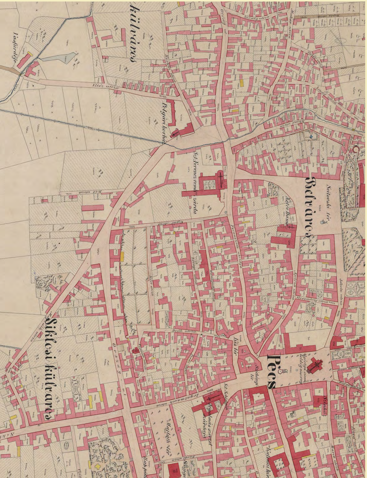
■ Pécs belvárosa az 1865. évi térképen, a 489. hrsz. telek a Skála-ház (MNL OL, S 78 - 36. téka - Pécs - 32.), L. ehhez Kiss Márton cikkét