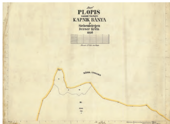
■ Gotthard Wokalek: Gyümölcsésés dűlönkénti felméréseinek első szelvénye, 1856. Másolta Thomas Hanus (MNL OL, S 78 - 345. téka - Plopis - 1.)