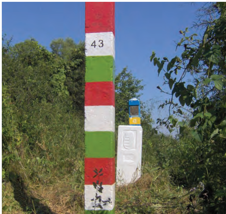
■ A Magyar Királyság és a Csehszlovák Köztársaság határjele (1925) a mai magyar–ukrán határszlopok között

Amit napjainkban magyar–ukrán államhatárként ismerünk, az hazánk legfiatalabb határszakasza, mert Ukrajna 1991. augusztus 24-én kiáltotta ki függetlenségét. A trianoni békeszerződés (1920) a kialakult évezredes természetes határokat figyelmen kívül hagyva Magyarországtól leválasztotta Kárpátalját és az akkor újonnan létrejött Csehszlovákiának adta. A megkapott terület kormányzása az új hatalomnak is jelentős politikai, közigazgatási és gazdasági gondokat okozott (a kárpátaljai Kőrösmező Prágától csaknem 1000 km-re fekszik). Magyarország és Csehszlovákia – mint „új szomszédok” – 1922–1925-ben meghatározták a határvonal pontos vonalát, majd elkészítették az új határokmányokat (felvételi előrajzok, határtérkép, határleírás). A Tisza folyó a nagyhatalmi döntés értelmében több szakaszon határfolyóvá vált, csakúgy mint a Batár és a Túr patakok. Ezen a határvizeken az államhatárt ún. mozgó határként határozták meg, ami annyit jelent, hogy az államhatár vonala alkalmazkodik a természetes mederváltozásokhoz. A változásokat az időszakosan elvégzett felmérések alapján a határbizottság határozza meg. A II. világháború idején, 1939-től az államhatár egy rövid időre ismét a Kárpátok bérceire került, de a háború lezárását követően a politikai döntések ismét semmibe vették a történelmi alapokat. A kárpátaljai régiót azonban Csehszlovákia „átengedte” a Szovjetuniónak. Az 1945. június 29-én, Moszkvában megkötött szerződés bevezetője értelmében „a Csehszlovák Köztársaság