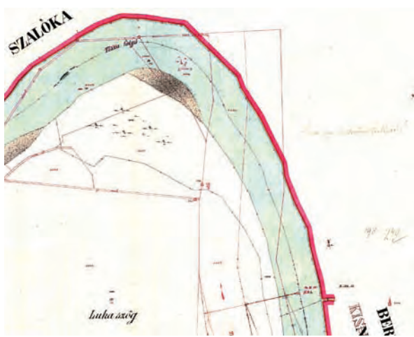
■ 4. Eperjeske 1885. évi térképe a változásvezetéssel (BFKH FTTF)

Az eredetileg Vásárhelyi Pál által tervezett szabályozások, mederátvágások sajnos nem mindenhol hoztak létre megfelelő lefolyási viszonyokat, a túlszabályozott folyón sok mederelfajulás, hirtelen vízszintapadás következett be. A szükséges korrekciós munkálatokat 1885-től Kvassay Jenő erős központi irányításával végezték el, többek között Eperjeske térségében is. A Tisza mederszabályozása utáni felmérések eredményeit, változásait az 1870. évi kataszteri térképre 1903., 1908. és 1909. években szerkesztették fel. A piros tussal végzett változásvezetés után már a folyószabályozás által létrejött új medreket is ábrázolja a térkép. E térképen egyértelműen látható Eperjeske, Lónya és Szalóka községhatára is (Szalóka területe napjainkban részben az államhatárral kettévágvva Tiszaszentmártonhoz tartozik.