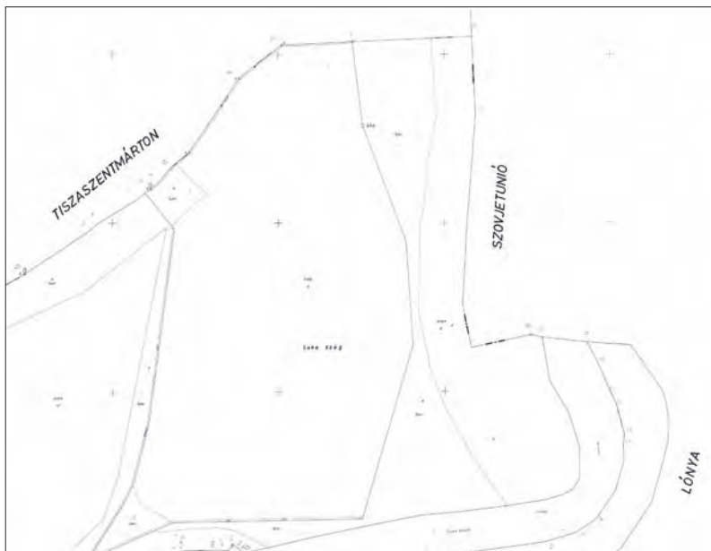
■ 5. Az 1977. évi földmérési alaptérkép (BFKH FTFF)

ingatlan egy része maga a Tisza határfolyó, egy része pedig még Ukrajnába is átnyúlik. (6. kép)