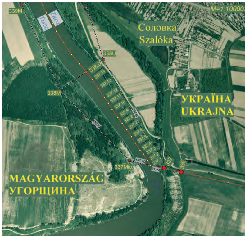
2. A magyar–ukrán államhatár 337. számú határjel jegyzőkönyvének térképe (részlet a magyar–ukrán államhatár határjeleinek leíró jegyzőkönyvéből)