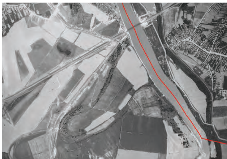
1. Az 1967. évi légifelvétel az 1948–1949-ben meghatározott magyar–szovjet államhatárral (BFKH FTFF)

lett. A demarkációt követően a Magyar Népköztársaság Kormánya és a Szovjet Szocialista Köztársaságok Szövetségének Kormánya 1950-ben kötött először szerződést az államhatárról, amelyet a két fél 1961-ben megújított. A Szovjetunió szétesésekor, 1991-ben létrejött Ukrajna az önállóvá válását követően hamarosan megkötötte a magyar–ukrán alapszerződést. Az alapszerződés elveire alapozva a két állam 1995. május 19-én, Kijevben kötötte meg az új szerződést az államhatár rendjéről (a továbbiakban: Szerződés). A Szerződést Magyarországon az 1998. évi LV. törvény hirdette ki.