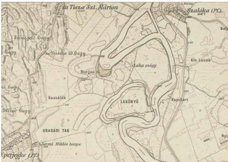
3. A Tisza kanyarulatai – Arcanum Mapire Adatbázis: Harmadik Katonai Felmérés (1869–1887) http://mapire.eu/hu/map/thirdsurvey25000 (megtekintés ideje: 2018. 04. 27.)

Magyarországon 1849-ben császári pátenst rendelte el a kataszteri felmérés megkezdését. A felmérés és így a kataszteri térkép célja is