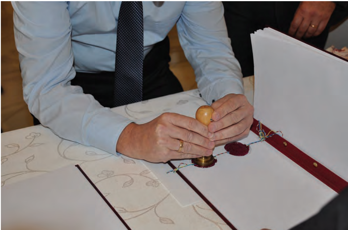
■ Magyar–ukrán határokmány jóváhagyása előtti pillanat: a Határbizottság viaszpecsétjeinek elhelyezése

A megoldáshoz az érintett közigazgatási szervek (járási hivatal, megyei hivatal, Felső-Tisza-vidéki Vízügyi Igazgatóság, Budapest Főváros Kormányhivatala) hatékonyabb és konstruktívabb együttműködésére lenne szükség. A „harcot azonban nem adjuk fel”, az államhatár átvezetése érdekében elindítjuk immáron a harmadik változásvezetési eljárásunkat.