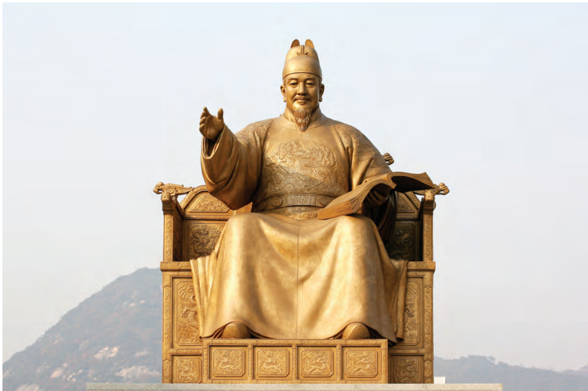
■ Sejong király szobra Szöulban

sek az országban, hogy a megszállók jobban tudják követni a földek tulajdonjogának változását, illetve stabilizálják az adóbevételeket. 7