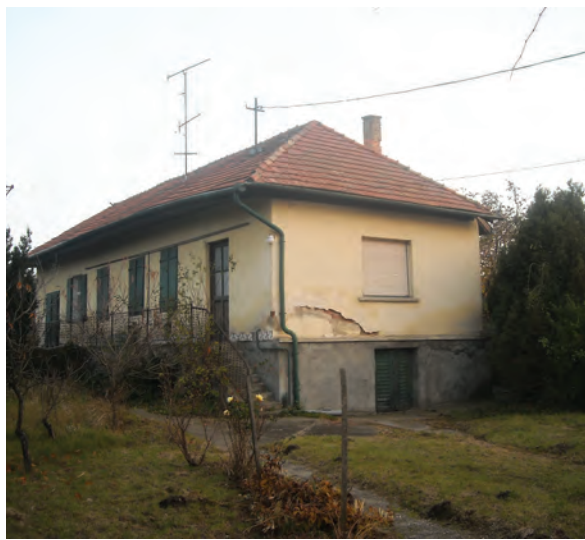
■ A középnemesi földbirtokos Bezerédj család szőlőbeli háza 1930-ban, illetve a jelentős átalakítást követően, lebontása előtt 2015-ben (Józsa Tamás mérnök-tanár, szakközépiskolai igazgató szíves közlése)

úgy, hogy szekerezve, csónakokkal, hajókkal a termelők közössége maga tartotta kézben az értékesítést, akár Tolna megyéig szállítva áruikat. 18 Az sem véletlen, hogy 1938 és 1944 között a hazai mélyhűtőipar egyik sikeres