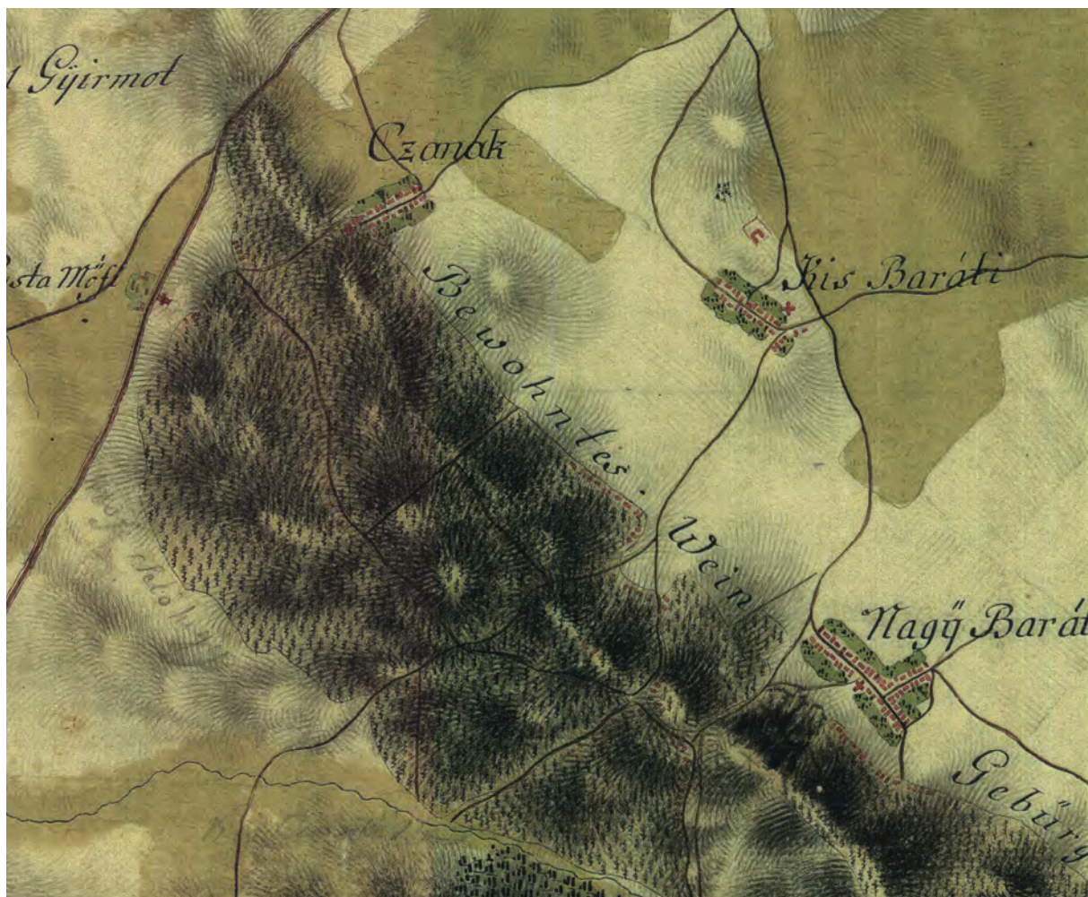
■ Az I. katonai felmérésen a Csanak, Ménfőhegy és Nagybarát közötti dombvonulat. A főbb utak mellett jelölték a lakóházak sorát. Az osztrák térképész felirattal is utal a szőlőhegyek lakottságára ( www.mapire.eu )

uradalmak kéziratos térképei általában csak a szőlők külső határvonalait rögzítették. Mivel a szőlők területe, birtoklása, birtokforgalma, gazdasági hasznosítása az úrbéri viszonyok rendezésénél a szántóktól, a legelőktől, az erdőléstől jogilag sok tekintetben eltért, az elkülönözési eljárásokhoz készített térképek számára érdektelen volt a szőlők részletes felmérése. Talán Háromnyúl 1840-ben készített határtérképe enged némi betekintést a hegyek területének részleteibe. Csanakfalú és a szőlőhegy részletes határtérképe 1857-ből már utalt arra, hogy a kataszteri felmérés mellékterméke. 16