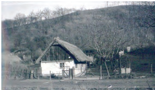
■ Nyúlhegy. Tanyaszerűen épült magányos lakóház, háttérében elvadult gyümölcsös, 1960 körül (Simányi Frigyes gyűjteményéből)