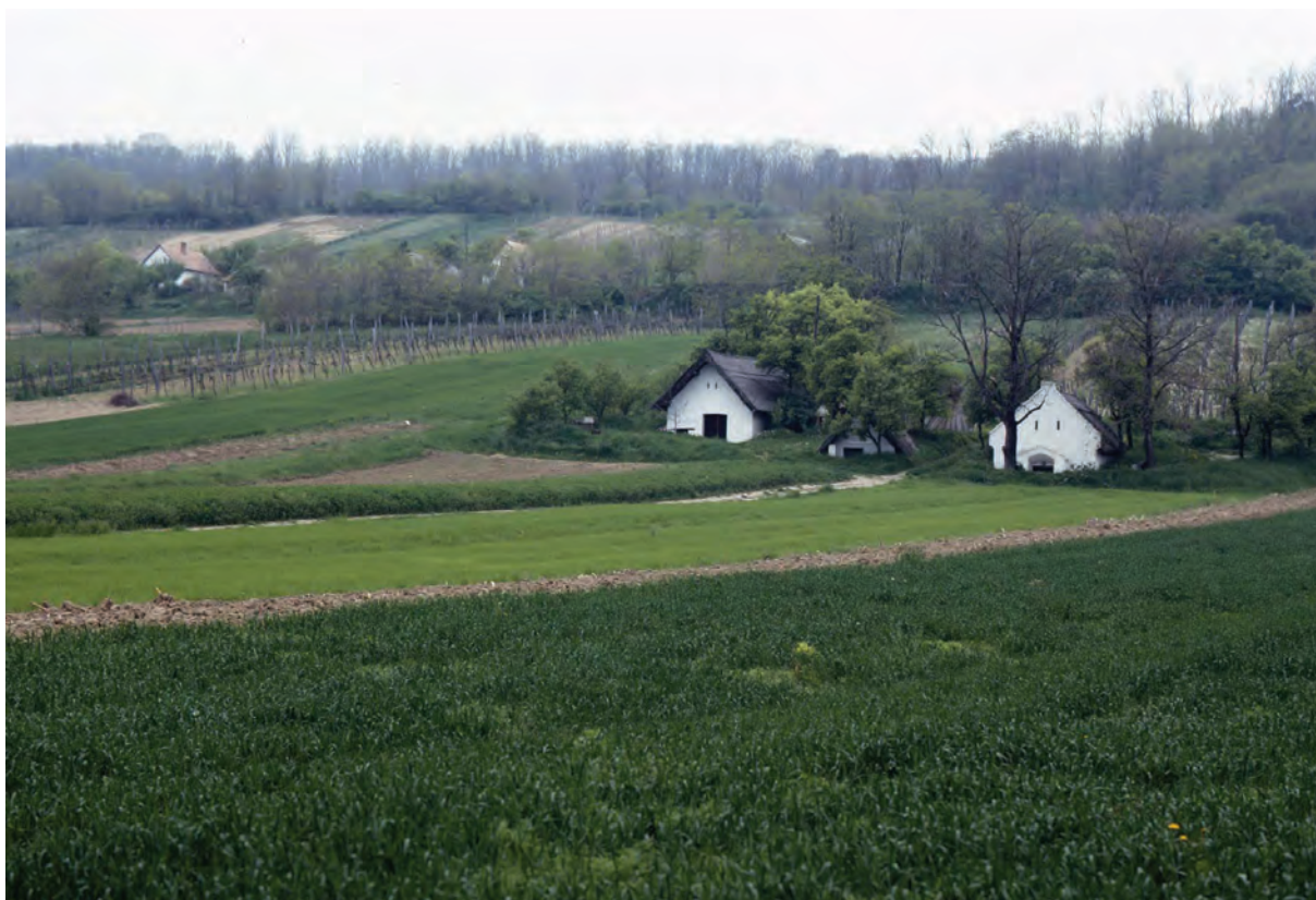
■ Kajárpérc, szőlőhegy tájképe, 2001. Előtérben a községből művelt szőlők pincéi, háttérben hegybeli lakóházak (Deim Péter felvétele, Rómer Flóris Művészeti és Történeti Múzeum, Győr, XJM NF 6024)

alakítsák ki lakóhelyeiket, a szőlészetre, borszatra és gyümölcsstermesztésre alapítsák megélhetésüket. Elégedjenek meg azzal, hogy zselléri állapotúakként tagolódnak a kortárs társadalomba.