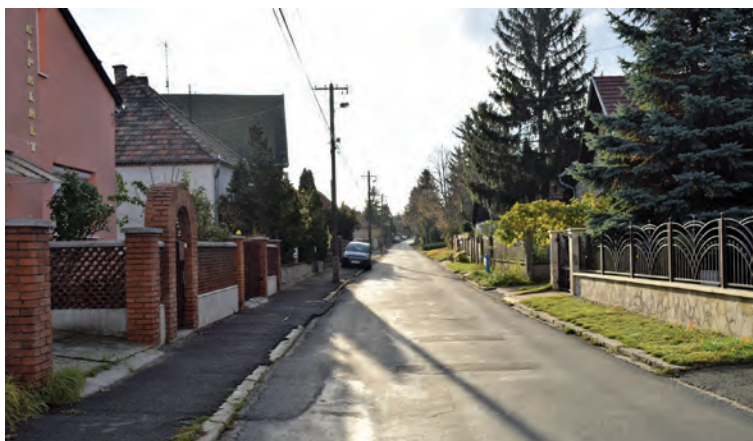
■ A 7. oldalon közölt ményfőcsanaki szőlőhegyi (egykor Rákóczi) utca mai képe, 2017