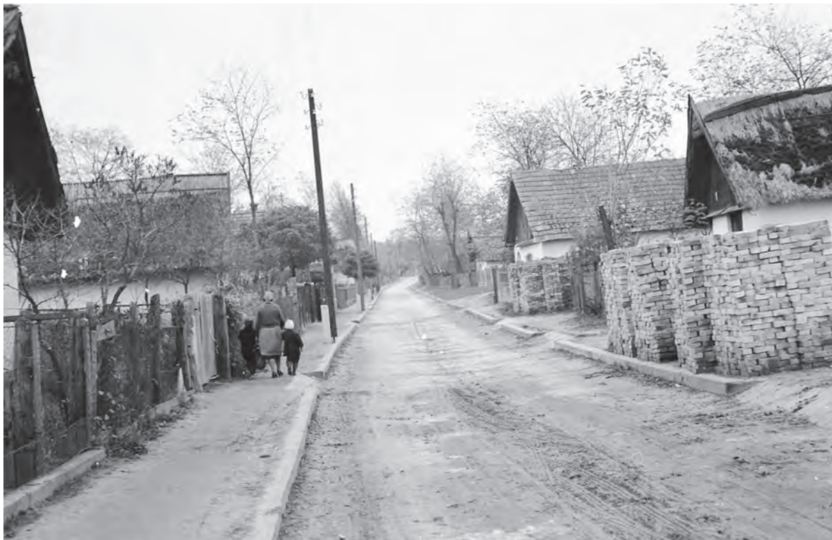
■ Sűrűn beépített szőlőhegyi utca. Ménfőcsanak, Rákóczi utca részlete, 1960