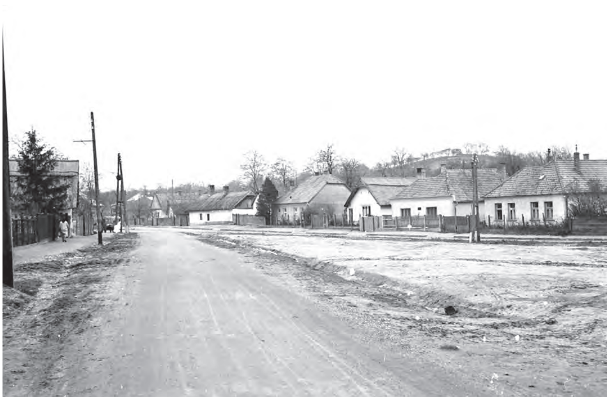
■ A szőlőhegyi település jellegzetes szakasza. A háttérben jól látszik a művelés alatt álló domboldal. Ménfőcsanak, a Rákóczi utca és a Szentháromság utca találkozási pontja, 1960