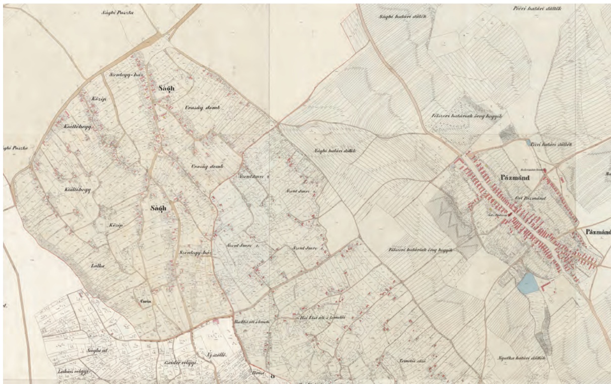
■ Győr-ság hegybeli község kataszteri térképe (MNL OL, S 78 – 97. téka – Győr-ság – 1–9.) Utcaszerűen sűrűsödő településrészek. A szomszédos Pázmándhegy lakóházai szórványként épültek fel