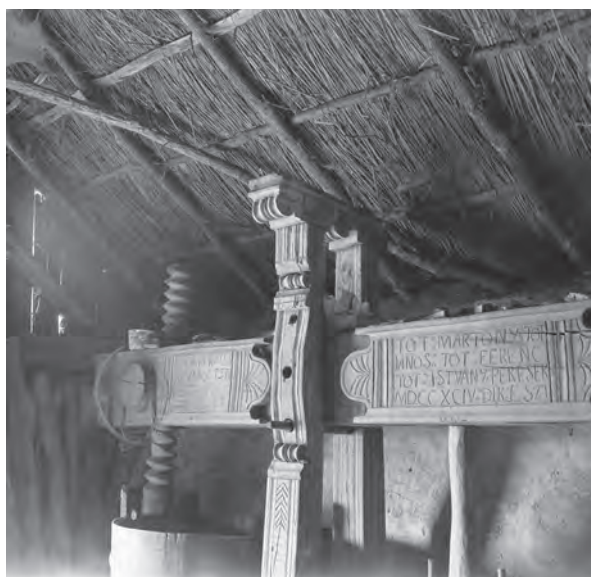
■ Tényő szőlőhegy. A községben élő szőlőtulajdonos pincéjének bálványos prése 1794-ből, 1960