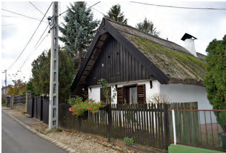
■ Ményfőcsanak szőlőhegyi utcáinak egyik utolsó hagyományos építésű lakóháza nádazott tetővel, sövényből font, tapasztott szabadkéménnyel, a ményfői Öreg utcából, 2017

nem elemzett dimenziókhoz vezethetnek el bennünket. Mondhatni, a kataszteri térképek – készülhettek azok akár 1856-ban – 160 év után is aktuális, egyben egyetemes értékű, tudományos tanulságokat rejtenek. Ezekből társadalom-, gazdaság- és agrárpolitikai következtetések is levonhatók! Rajtunk múlik, hogy az üzenetüket kellő módon tolmácsoljuk, közkinccsé tegyük, és meg is fogadjuk/fogadtassuk! 19