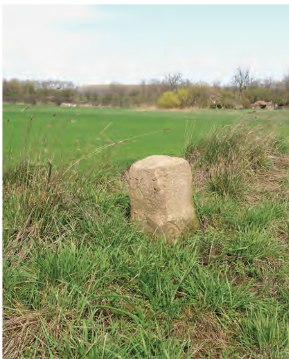
■ 12. „KF” betűkkel jelölt oszló a 16. sz. határdombon

A vasútvonalhoz legközelebb meglévő határdomb (10. kép) tetején szabályos hasáb alakú, terméskőből faragott földmérési jel van, „KF” bevéséssel. Eredete nem ismert, hasonló tudomásom szerint eddig nem írtak le az országban. Az 1884. évi kataszteri térkép háromszögelési pontot jelöl ezen a helyen, a 16-os számú határdomb jelét négyszöggel keretezve