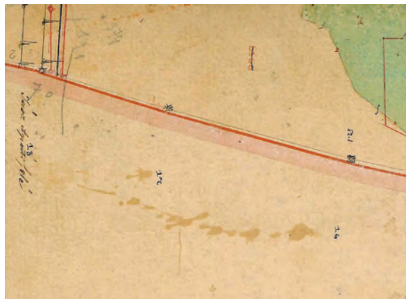
■ 11. Jászdózsa–Jászapáti határszakasz a 16-os számú határdombbal és háromszögelési ponttal (Jászdózsa birtokvázlata, 1884)

ter magas, kör alaprajzú, valójában csak egydombos „Hármashatár” a Jászdózsa–Tarnaörs közötti határ keleti sarokpontja és egyben a Jászdózsa–Jászapáti határ északi sarokpontja. A „Hármashatár” a dózsai lakosok által ma is ismert és használt helynév. A megnevezés az öt sarokhatár közül egyedül a Jászdózsa–Tarnaörs–Jászapáti sarokra vonatkozik. A Hármashatáron kívül öt határdomb található északon Tarnaörs felé. Keleten, a Jászdózsa–Jászapáti határon, annak két végpontját lezáró két „hármashatáron” kívül hat további határ-