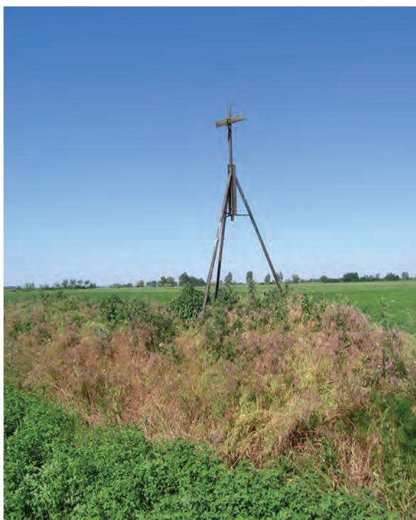
■ 13. Gúla (tripód) határdombon a Jászdózsa–Jászapáti határon