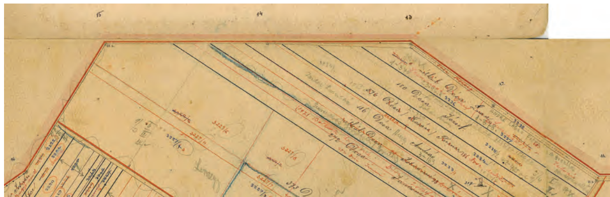
■ 4. 11–16-ig számokkal jelölt határdombok a jászárokszállási határon (Jászdósa birtokvázlata, 1884)

A birtokvázlatot 1898-ban Glocker Ottó ellenőrizte és javította, a javítások azonban egyetlen határdombot sem érintettek. Piros tintával az új telekosztásokat és új épületeket rajzolta be, illetve beírta az időközben módosított helyrajzi számokat és új telektulajdonoso-