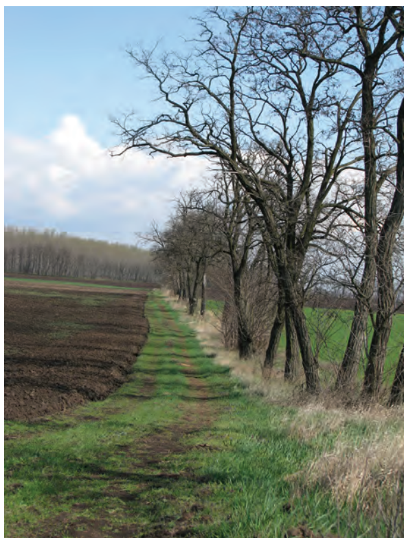
■ 21. Dűlőútíásítás akácfával Jászdózsa–Jászapáti határán

meg a határdombokat, a korábban rendszeres határjárások elmaradtak. A pontos felmérés alapján készített térképek korában a határjelek elvesztették határjelölő, határőrző jelentősé-