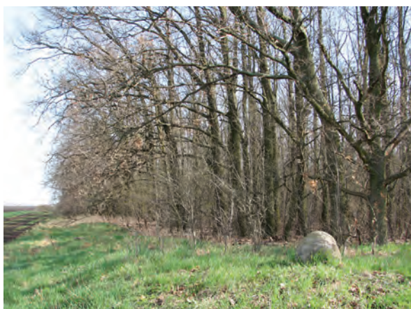
■ 19. A birtokvázlaton 13-as számmal jelölt, köves határdomb Jászdózsa–Jászárokszállás határán