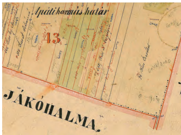
■ 5. Jászdózsa–Jászapáti–Jászkóhalma sarokhatár, három határdombbal, betűjelekkel és a határvonalon pontjelekkel (Jászdózsa birtokvázlata, 1884)