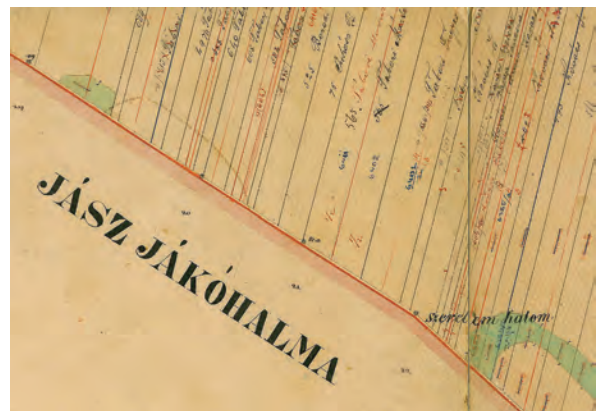
■ 16. A „Szerelem halom”-nak nevezett 22-es számú határdomb a birtokvázlaton

Jászdózsa és Jászárokszállás között 15 határdomb található, ebből 12 északon és három