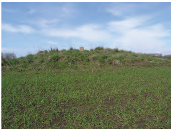
■ 10. A birtokvázlaton 16-os számmal jelölt, ovális alaprajzú határdomb Jászdózsa–Jászapáti határán