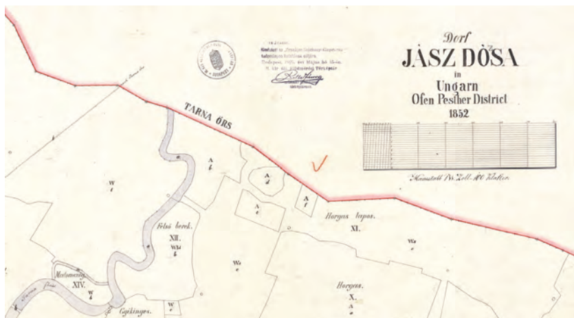
■ 3. Határdombok Jászdósa–Tarnaörs határán az 1852. évi ideiglenes kataszteri térképen, részlet (OSZK, Térképtár K-601 A 2)

san behúzott vonalon 9 – pontokkal jelöli a 30 öles távolságokat.