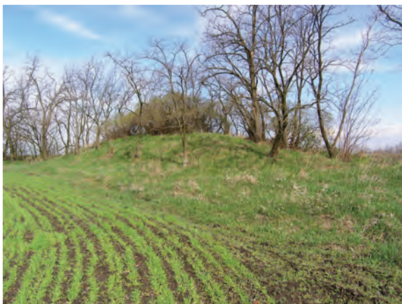
■ 15. A Szerelem-halom Jászdózsa–Jászfákóhalma határán

Délen, Jászdózsa–Jászfákóhalma határán a ténylegesen is háromdombos Apáti sarkon kívül még három határdomb van. Közülük az egyik a 19. században, így a birtokvázlaton is, még a Dózsa–Berény–Jákóhalma sarokpontot