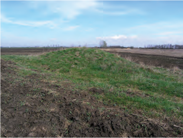
■ 14. Jászdózsa–Jászfákóhalma, határdomb a Holt-Tarna mellett

(11. kép). Birtokjelként elhelyezését kizárja az, hogy a betűjel a határvonal felé mutat, nem Jászdózsa vagy Jászapáti felé. Ugyancsak birtokhatár jelet kizáró tényező, hogy a jászszági településeken – így sem Jászdózsán, sem a szomszédos Jászapáti – soha nem voltak nagybirtokosok. Azt feltételezem, hogy a követ a kataszteri felméréshez – 1852-ben vagy 1884-ben – helyezték el, a „KF” betűk (12. kép) pedig talán a „Kataszteri Felmérés” kezdőbetűi lehetnek.