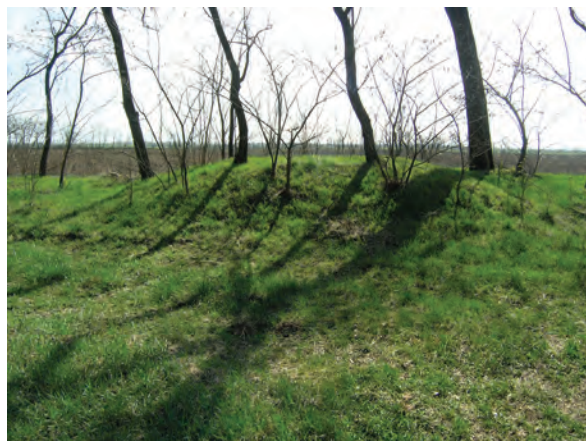
■ 9. A birtokvázlaton 3-as számmal jelölt határdomb Jászdózsa–Jászapáti határon (Jászdózsa birtokvázlata, 1884)

A 32 km hosszúságú jászdózsai határvonalon jelenleg 34 határdomb lelhető fel. A fél mé-