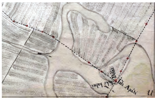
■ 1. Jászdózsa–Jászapáti–Jászkóhalma sarokpont Bedekovich Lőrinc térképén. XII. szelvény, részlet (MNL HML, Térképtár Heves T 120.)

A Jászdózsáról 1852-ben, mindössze három évvel a szabadságharc leverését követően 1:7200-as méretarányal készített ideiglenes felmérés térkép-vázlatán 140 határdomb látható. 8 Az egyébként viszonylag kevés adatot tartalmazó, a belterületet üresen hagyó térkép különös alapossággal ábrázolja a határvonalat és a határjeleket (3. kép). A határdombokat λ jellel tünteti fel. A sarokhatárokon is csak egy-egy dombot jelöl – a dózsait – a nyilvánvalóan akkor is ott lévő háromból. A határdombok közötti távolság általában a 30 bécsi öl többszöröse (2x, 3x, 4x, 5x 30 öl stb.) – a leghosszabb a 13 x 30, azaz 390 öl (740 méter) távolság. A térkép a határon – a felmérési utasításban előírt jelkulcsnak megfelelően végig folytono-