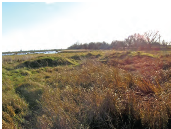
■ 18. Hármas határdomb a JD, JB, JÁ betűkkel jelölt sarokhatáron