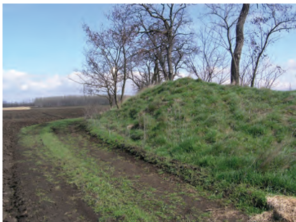
■ 8. A birtokvázlaton 8-as számmal jelölt határdomb a Jászdózsa–Jászapáti határon

A kataszteri felmérések térképei azt mutatják, hogy a határdombokat elsősorban a határvonal töréspontjain, az állandó vagy időszakos vízfolyások, illetve a holtágak egyik vagy mindkét partján, valamint a településközi utaknak és a helyi dűlőutaknak a határhoz érkezési pontjainál készítették. Mivel a vízjárta területen természetes magaslatok, kisebb-nagyobb halmok is voltak, amelyek szerepet kaphattak a két település közötti határ kijelölésekor, feltételezhető, hogy azok magasztásával is készítették határdombokat. A 19. században a határvonal nagy részén – lehetséges, hogy teljes hosszában – szekérral járható dűlőút vezetett. A nyugati határt részben a Berény–Árokszállás közötti, Jászberényt Gyöngyössel összekötő országút jelentette, amely