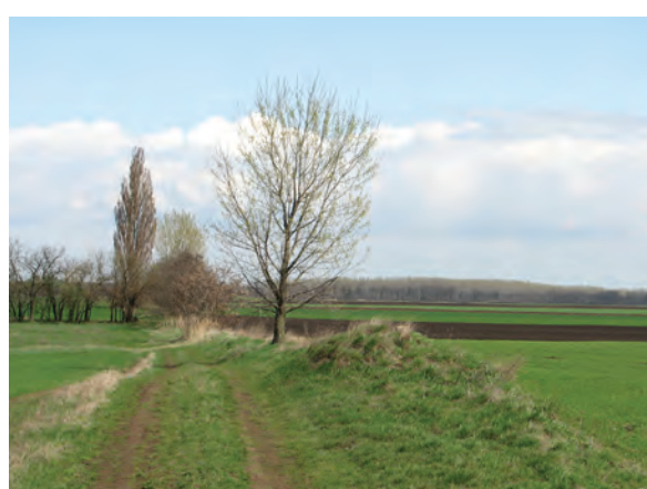
■ 20. A Jászdózsa–Jászapáti határon menő dűlőút a birtokvázlaton 16-os számmal jelölt határdomb Jászdózsa felőli oldalán

nyugaton. Különleges határjelnek számít az alacsony földhányás tetején, viszonylag nagyméretű terméskövel jelölt erdőszéli határdomb (19. kép).