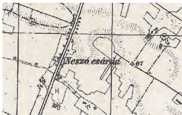
■ 2. Jászdózsai határdombok a harmadik katonai felmérésen. 15/XXII. szelvény, részlet