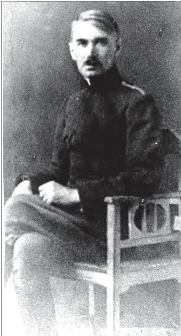
■ ... és a végén

az első perctől kezdve iszonyodva ellenezte a háborút. Nem kétséges, hogy Gém az Olymp alatt című verse Adyt persziflálja. Ismerve némelykor radikális szabadgondolkodó múltját, meglepő ez a jobbrafordulás, mint ahogy az is meglepő, hogy ezek után az őszirózsás forradalom néhány vezető személyiségével kapcsolatot tartott. Nincs megbízható adatunk arra nézve, hogyan fogadta a tanácsköztársaságot, ellenben – ha hihetünk Rákosi Jenőnek – a négyéves frontszolgálat és sebesülés után, még 1919 augusztusában is készen állt arra a romantikus kalandra, hogy fegyverrel szerezzék vissza Nagyváradot. Végül is a daliás kataszteri mérnök – Heidegger kifejezésével élve – autentikus személyiség volt abban az értelemben, hogy mindenkor vállalta a választás teljes felelősségét, a halállal való illúziómentes szembenézést, ugyan-