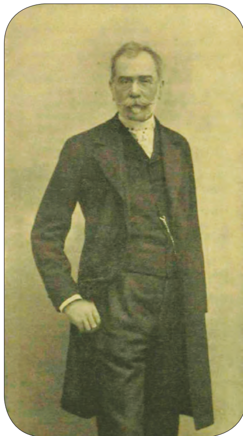
Mohay Sándor (1851–1901), ügyvéd, szabadelvű képviselő, igazságügy-minisztériumi államtitkár

akkor, ha először igazoltatik, hogy a telekkönyvben bejegyzett tulajdonos legalább három év előtt elhalt, vagy holléte legalább három év óta nem tudatik, másodsor, ha azon egy vagy fokozatosan több vagyonátruházás, melyek által a tulajdonjogigény a tényleges birtokosra átment, a helyhatóság és bizalmi férfiak nyilatkozata által igazoltatik, és végre harmadszor, ha a tényleges birtokos kimutatja, hogy ő maga s illetőleg ő és telekkönyvön kívüli birtokos elődjei az ingatlan 10 éves békés birtokában volt.” A törvényjavaslat egyes részeit ugyanakkor az igazságügyi bizottság vitatta, így például alkalmasnak látta az értelmetlen zaklatásra, és ezért a 73–74. §-ban foglaltak mellőzését kérte, ezek ugyanis bírságot helyeztek kilátásba, ha a telekkönyvi átírást a vagyonátruházást követően 30 napon belül nem kéri a telekkönyvi hivataltól, amely minderről az illetékkiszabási hivataltól értesülhetett az új szabályozás értelmében. Fabiny Teofil igazságügy-miniszter szerint a törvény célja: „Egyrészt a hiányos, elavult, ideiglenes hitellekkönyveknek