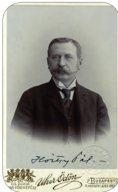
■ Hoitsy Pál (1850–1927) hírlapíró, csillagász, szemészorvos, függetlenségi képviselő

vetették ki azt. Miután megállapította, hogy az új kataszter még az abszolutizmus koránál is rosszabbul sikerült, azt indítványozta, hogy a képviselőház nevezzen ki egy szakbizottságot, amely a pénzügyigazgatás és államháztartás gyökeres átalakítására javaslatot dolgoz ki. 15