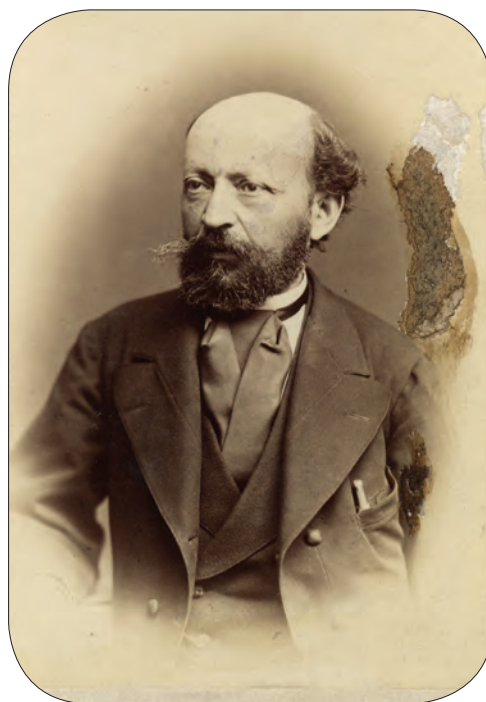
■ Helfy Ignác (1830–1897) író, függetlenségi képviselő

adókönnyítést hozó ártérvalósításokra, sőt az erdélyi részeken még birtokrendezésre vannak elkülönítve. Mindez a rendes adminisztráció keretein belül, adófelügyelőkre bízva megoldhatatlan. Abban egyetért a felszólalóval, hogy a nyilvántartás vezetése elsősorban a felek érdeke, ugyanakkor a múltból látható, hogy hova vezet ez a felfogás. Kitarzott amellet, hogy az intézkedések szükségesek, az apparátus létszámát illetően pedig a lehető legnagyobb takarékossággal járt el. Helfy Ignác (Udvarhely vármegye, Székelykeresztúr kerület) Horánszkyval értett egyet, és pazarlónak tekintette az új javaslatot, amely „körülbelül 200 új hivatalnokkal akarja boldogítani az országot”. Új szervezet helyett ő a meglévő adókerületeket bővítette volna néhány alsóbb beosztású hivatalnokkal. A pénzügyminiszter lépését humánusnak nevezte, mivel nem akarta a kataszteri munkálatok befejezésével a sok benne részt vevő embert elbocsátani, az ország azonban nem fizetheti továbbra is a bérukét. Emellett nehezményezte, hogy minden törvényjavaslatban van valami speciális kitétel Erdélyre vonatkozóan, pedig véleménye szerint – erdélyi emberként és képviselőként – az unió létrejötte után éppen Erdély különállását kellene megszüntetni az anyaországtól. Azt kérte, hogy