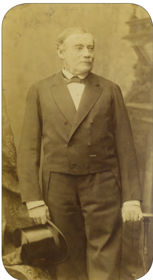
■ Fabiny Teofil (1822–1908) jogász, igazságügy-miniszter (1886–1889)

rendes telekkönyvi betétekké való átalakítása, másrészt ezzel kapcsolatban a földadókönyvvel és a kataszteri munkálatok adataival való egészítése és ennél fogva egyrészt a jogbiztonság megállapítása, másrészt az ingatlan hitelképességének emelése.” Mohay Sándor (Gyulafehérvár város) felszólalásában örömmel fogadta a törvényjavaslatot, ám egyúttal sajnálatát is kifejezte amiatt, hogy a rendezés a bányabirtokokat és így a bányatelekkönyveket nem érinti, pedig ezek adminisztrációja is hanyagul volt vezetve.