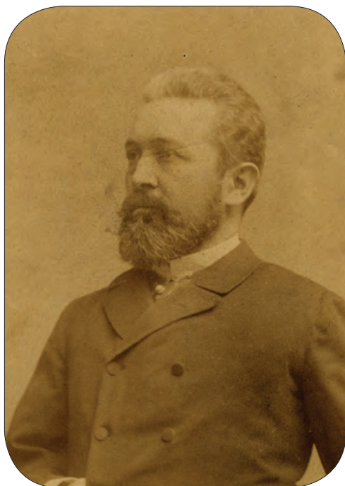
■ Hórai Horánszky Nándor (1838–1902) jogász, egyesült ellenzéki képviselő

az csak az adminisztráció költségesebbé és bonyolultabbá tételét fogja eredményezni. Hangsúlyozta, hogy a kataszteri munkálat elkészítése évi 2 millióba került, és most ennek az összegnek a 20 százaléka állandóan szükséges lesz a karbantartásához, amit abnormális állapotnak nevezett. Úgy vélte továbbá, hogy az adóelévülés következtében elszenvedett államkincstári veszteség nagyon csekély, nem indokolja ezt a nagy apparátust: helyette a kataszteri íveket az érdekelteknek legyen kötelező karbantartaniuk, aminek el nem végzéséből adódó hátrányukat maguk viseljék. A nyilvántartási teendőket pedig a jelenlegi pénzügyi adminisztratív hatóságok lássák el, erre újabb közeg felesleges. A múltban sem az adminisztrációban dolgozók alacsony létszáma okozta a nyilvántartások elhanyagolását, hanem az a tény, hogy senki sem érezte fontosnak azok vezetését, hacsak a felek maguk utána nem jártak.