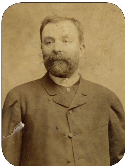
■ Ugron Gábor (1847–1911) függetlenségi képviselő 13

(ma Lesenice, Szlovákia) hozta fel, ahol a főispán birtoka után feleannyi jövedelmet mutattak ki, mint korábban. Tisza Kálmán miniszterelnök az elhangzott vádakat határozottan visszautasította: nézete szerint megeshetett ugyan, hogy egyes főispánok adója az igazságosabb beosztás révén alászállt, másoké azonban ugyanezen okból kifolyólag bizonyára emelkedett. Az ilyen alantas vádaskodást méltatlannak és nem a parlamentbe illő dolognak minősítette. 12