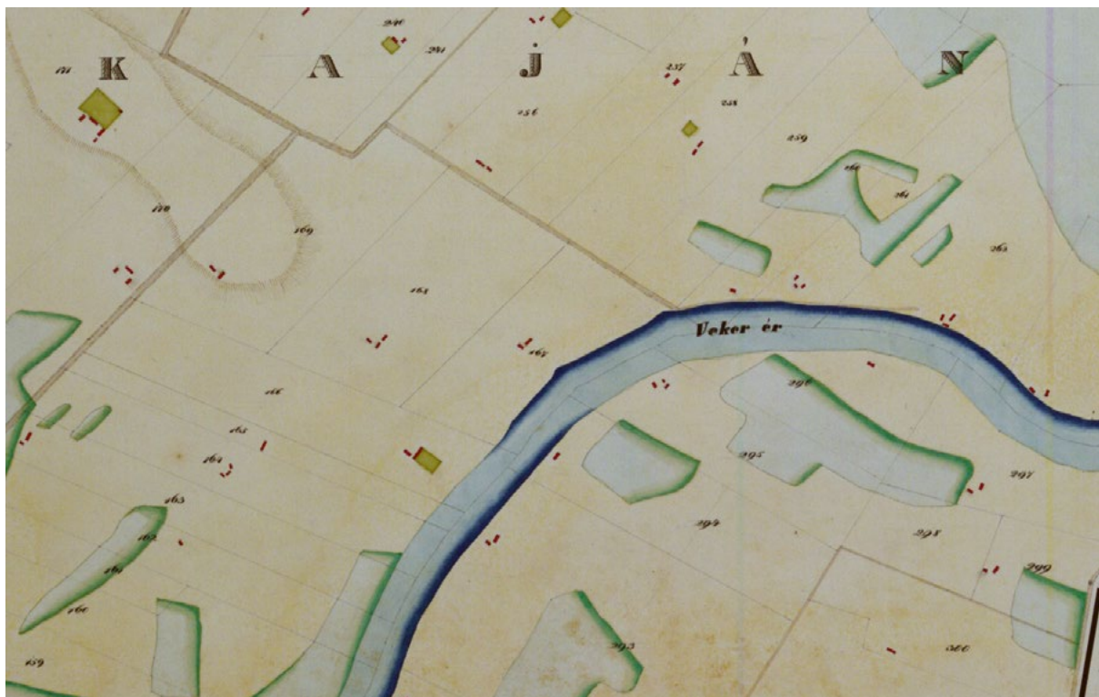
■ Tanyák a város északi szántóterületén Kaján határrészen a Veker mellett (Seress László: Szentes város térképe, No. 10., részlet)

A térkép megörökített szép számmal olyan szántókat, amelyeken nincsen nyoma annak, hogy tanyát építettek volna rajta gazdái, noha a várostól, a gazda lakóhelyétől nem kis távolságra estek. A kibontakozó, kortársi mezőgazdasági szakirodalom néhány alkalommal éppen Szentest említve ismertetett olyan példákat, hogy az épület nélküli szántókon a csak gabonát termelő gazdák az aratást, azaz a takarást követően a saját földjük alkalmi szűrűjén elnyomtatták a termést, csak a magot vagy a garmadát szállították el. Az 1950-es évek derekán Tálasi István professzor egyete-