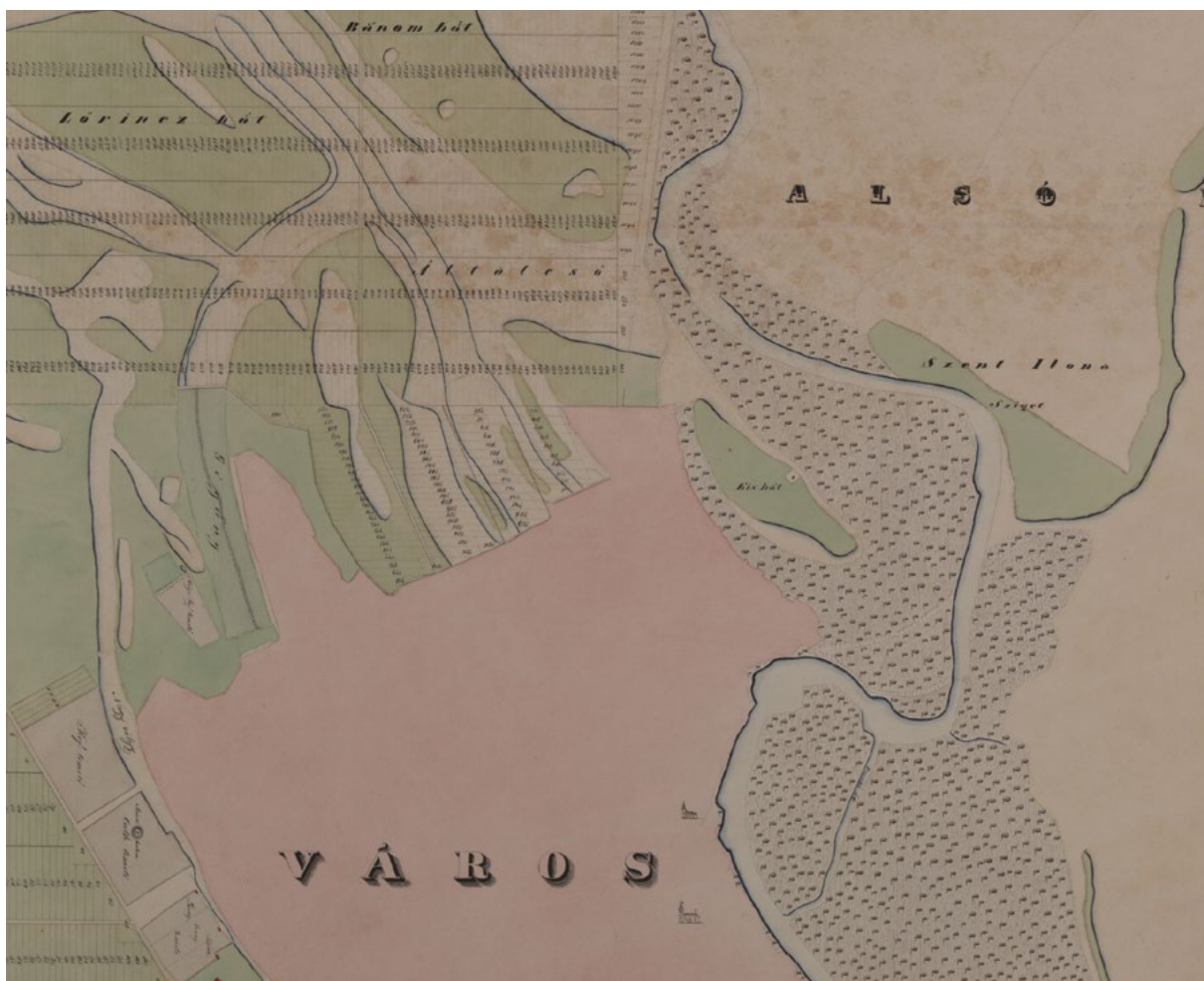
■ A város és déli előtere (a kép jobb oldalán) a menedékhelyül szolgáló Szentilona-parttal és a Bereklapos házutáni földek tervezett kiosztásával (a kép bal felső részén) (Seress László: Szentes város térképe, No. 21., részlet)

volt, de rossz gabonatermés idején lisztpótlóként is bevált. Az Európa-szerte ismert, gyűjtögetett vizinövény fogyasztása az őskorig nyomon követhető. Az Alsórét délnyugati szögletében ma is ismert a Sulymos-tó földrajzi név. A gyékény (amiből nélkülözhetetlen tárolóeszközöket fontak, takarókat, szőnyeget szőttek) és a nád ipari és építőanyagként (kerítések, falak, födéme) szolgált. Mindkét vizinövény nélkülözhetetlen volt tüzelőanyagként, hiszen kimeríthetetlen mennyiségben rendelkezésre állt. Ősszel a város hiteles kerekével mérték ki a réti területek nádját, gyékényét a lakosság számára. A házak, a háztelkek és a birtokolt föld arányában változó kerékfordulatszám szerint (változó szélességű) területet bocsátottak a lakosok rendelkezésére. Nádat kaptak illetménykiegészítésül a város szolgálatában álló értelmiségiek is. A város népe