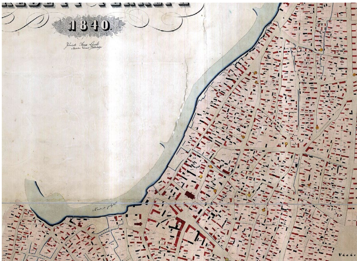
■ A város történeti magja eredetileg útifalu. A település növekedésével keletkező új utcák szigorúan és észszerűen a környezet szintviszonyaihoz alkalmazkodtak. (Seress László: Szentes város belterületének térképe, részlet)

mindkét irányban a település egykori vége felé a hosszan párhuzamosan futó utcák összefutottak. Ennek következtében ismétlődően az utcák csatlakozásánál háromszögletű terek alakultak ki. (Térképünk tanúsága szerint ezekre szívesen telepítettek szárazmalmokat.) A város utcáinak jelentős része észak–déli irányú. A hajdani távolsági forgalom jelentős részének ez előnyös volt, hiszen a várost könnyen el lehetett érni a Bódi-rév Kurca-partra csatlakozó útjáról, és déli irányban könnyen tovább lehetett haladni Csongrád és Csanád vármegyék települései felé. Ebbe az észak–déli forgalmi tengelybe kelet felé két fontos irányban keresztutat kellett kialakítani. Az egyik Békés vármegye északi részei felé Szarvasra, Békésbe vezetett, ebből ágazott ki a középkori Szentlászló határában a Kunszentmárton felé vezető út. A másik keleti irányú keresztteny Békés vármegye déli településein át Arad felé és azon túl, a Maros völgyén Erdély belső területeire vezetett. Az előbbi a mai Arany János utca, a másik a főutca funkcióját betöltő Kossuth Lajos utca (már utaltunk rá, hogy a folytatása emberemlé-