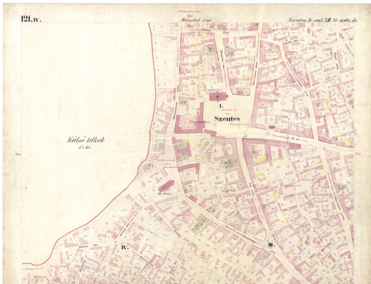
■ Szentés kataszteri térképe (121.IV. szelv.), 1882 (FÖMI)

Szinte mindegyik dokumentumon vezették a birtokos személyében vagy az adótárgyban beállt változásokat. Ha kevés változás volt, akkor magában az eredeti dokumentumban a régi adatot áthúzták, és fölé írták az újat, többnyire piros tollal. Ha erre nem volt lehetőség, akkor függeléket csatoltak az eredeti dokumentumokhoz, vagy egyes részeket, például a felvételi előrajz egyes lapjait újból