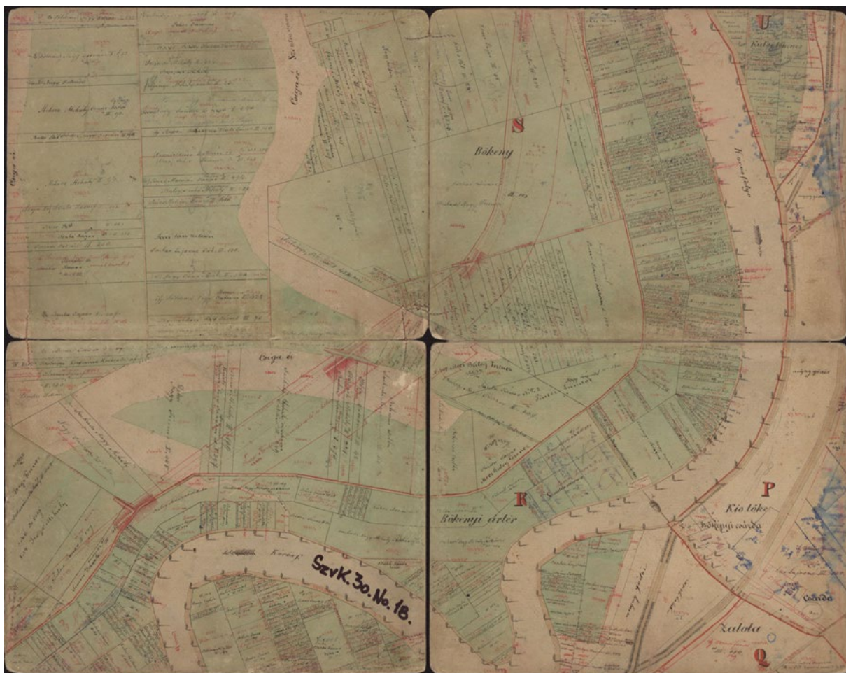
■ Szentés birtokvázlata (18. szelv.), 1882 (MNL CsML SzL, XV. 3. SvK 30.)

A birtokvázlatokat is negyedlaponként készítették el, majd szelvényenként a negyedlapokat vászonszalaggal összeragasztották. A Szentés rendezett tanácsú város Csongrád megyében 1882 című birtokvázlat 1882 őszén készült el,