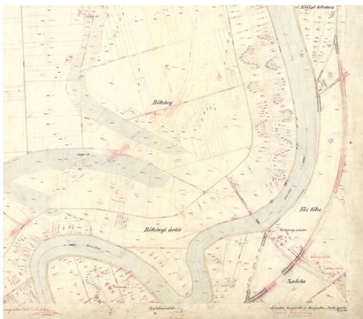
■ Szentés kataszteri térképe (18. szelv.), 1882 (FÖMI)

vett részt Szentés térképének kidolgozásában: Albrecht Ernő, Berczeli István, Janák Antal, Jindrak Ferenc, Makai József, Nepkó Gyula, Perhács Béla, Rác István, Schöbitz Ferenc, Siebert Emil, Soukup Ferenc és Szimonisz Arnold. A szelvény jobb alsó sarkában megnevezték a felvételt, a területszámítást és a kirajzolást végző személy(ek)eit: „felmerte, kiszámította és kirajzolta”. A leggyakrabban egy, olykor két személy nevét találjuk itt. A térkép címét arra a szelvényre írták, ahol erre elegendő hely volt, Szentés esetében ez a 3. szelvény. A cím alatt megadták a léptéket és a következő záradékot: „Vizsgálta és a jegyzőkönyvekkel teljesen összegegyezőnek találta: Traupmann felügyelő”. Szentés szelvényeit négy palliumba („térképboríték”) helyezték, a 4.