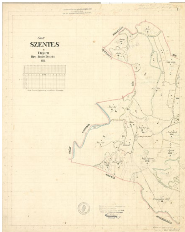
■ Szentes konkrétális térképének első szelvénye 1852-ből (OSZK Térképtár K 1 235 A 1–2.)

A térképen a vízhálózat (folyók, tavak, patakok) kék, az ösvények barna, az utak vörössel