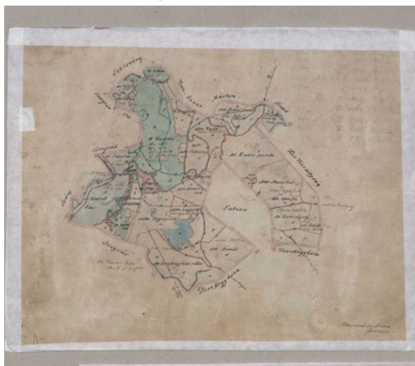
■ Szentes kataszteri térképvázlata kb. 1852-ből (OSZK Térképtár Bv 868/1.)

ganzen Catastral Gemeinde Szentes (Összeállítása Szentes kataszteri község dűlők és művelési ágak szerint felmért területének) című mellékletben teszik meg, amely táblázatba foglalva mutatja a számmal és névvel egyaránt feltüntetett dűlők, valamint a betűvel jelölt „aldűlők” (No., Namen des Riedes, Litera) művelési ágát (Benennung der Culturs-Gattung), a művelési ág területének nagyságát, alsó-ausztriai holdban és négyszögölben megadva, emellett lehetőséget biztosít a megjegyzések (Anmerkung) leírására is. A táblázat tehát rögzíti a felmérés során Szentesen tapasztalt gazdasági állapotokat. Így kiderül, hogy ekkoriban Nagyhegyen és Berkiszöllön végig szőlősök húzódtak, gyakorlatilag Kistőke egésze rét volt, míg Nagytőkén , Berkiháton , Szörfűn , Eperjesen , Mucsiháton , Pankotán szántóföldek feküdtek. Emellett tanulmányozhatjuk, hol és mekkora területen voltak ebben az időpontban erdők, kertek és legelők. A művelési ágak mellett feltüntették az utakat és a folyókat is mint terméketlen területet, amelyeknek nagyságát ugyancsak megadták. A táblázat alapján Szentes termelés alá vont része összesen 66 279 alsó-ausztriai hold, a terméketlen pedig 4444 volt (összesen 70 719 hold, helyesen 70 723 lenne). Később piros színnel javításokat végeztek a dokumentumon, ám