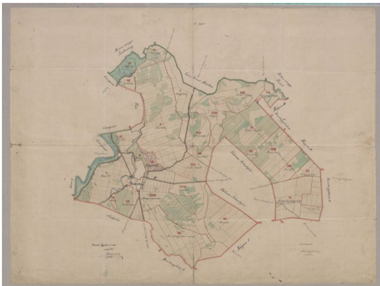
■ Szentes kataszteri térképvázlata 1877-ből (OSZK Térképtár Bv 868/3/1.)

száma; művelési ágak (ezen belül: szántófield, kert, rét, szőlő, legelő, erdő, nádas, adómentes terület). 6