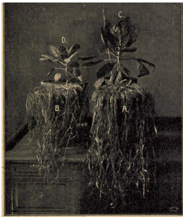
■ Villamos árammal kezelt és nem kezelt búza szalmájának és káposzta fejlődésének különbsége (Eredeti illusztráció Vozáry Pál cikkéhez, Köztelek , 1912)

Vozáry 1909-től egyre többet foglalkozott az elektromosság növények növekedésére gyakorolt kedvező hatásával, több cikket is szentelt a kérdésnek, ismertette az addigi külföldi