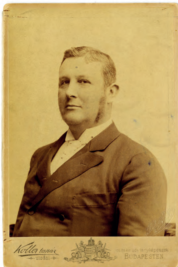
■ Wekerle Sándor (1848–1921) pénzügyminiszter (1889–1895), az állami tisztviselők fizetéséről szóló törvényjavaslat előterjesztője

Ez a rendszertelenség az állások közötti hierarchiában és adminisztratív szempontból hátrányt jelentett, de társadalmi hatása nem volt jelentős. A nagy probléma, az akkor már tartahatatlanság állapot az idők folyamán abból adódott, hogy egyrészt a kulturális élet új igényeket termelt, másrészt a gazdasági élet fejlődésével a megélhetés alapfeltételeinek megszerzése nehezebbé vált, a pénz vásárlóereje csökkent, a termények és lakások megdrágultak.