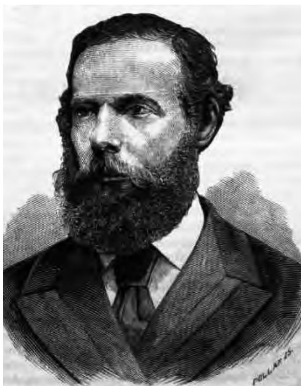
■ Zichy Nándor (1829–1911) gróf, országgyűlési képviselő