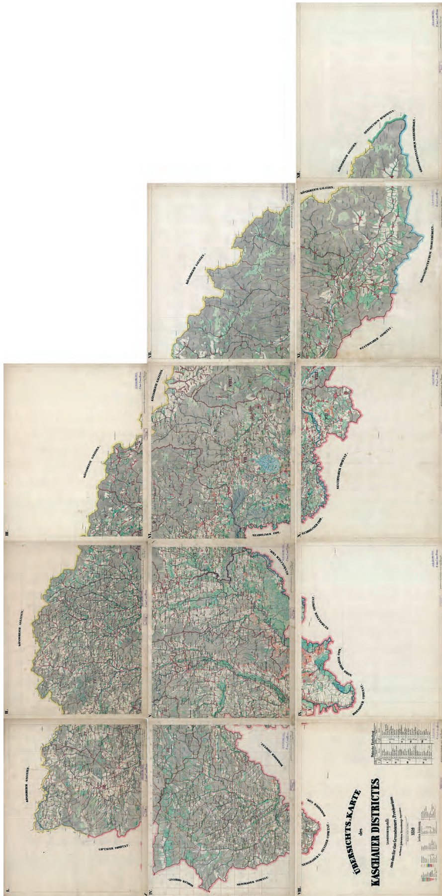
■ Josef Lokarner kassai adókerületet ábrázoló térképe, 1856 (OSZK Térképtár TK 2 086.)