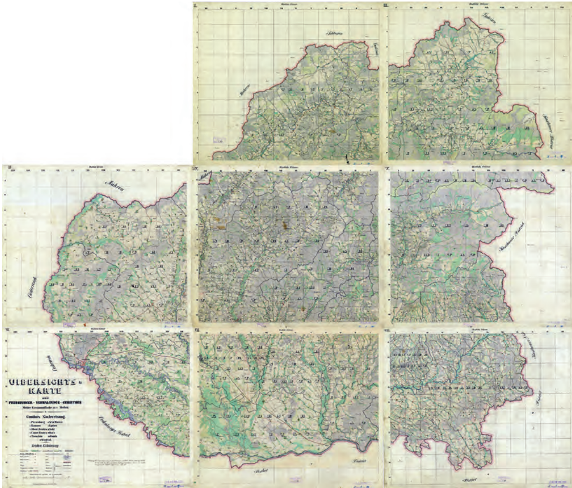
■ A pozsonyi adókerület térképe, 1858