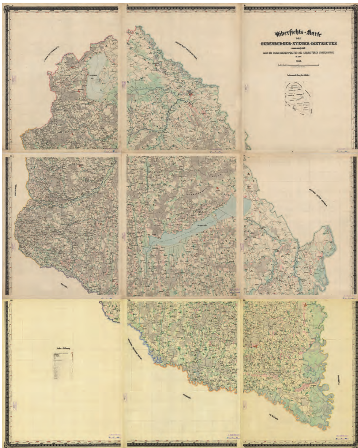
■ A soproni adókerület térképe, 1855 (OSZK Térképtár TK 1 902.)