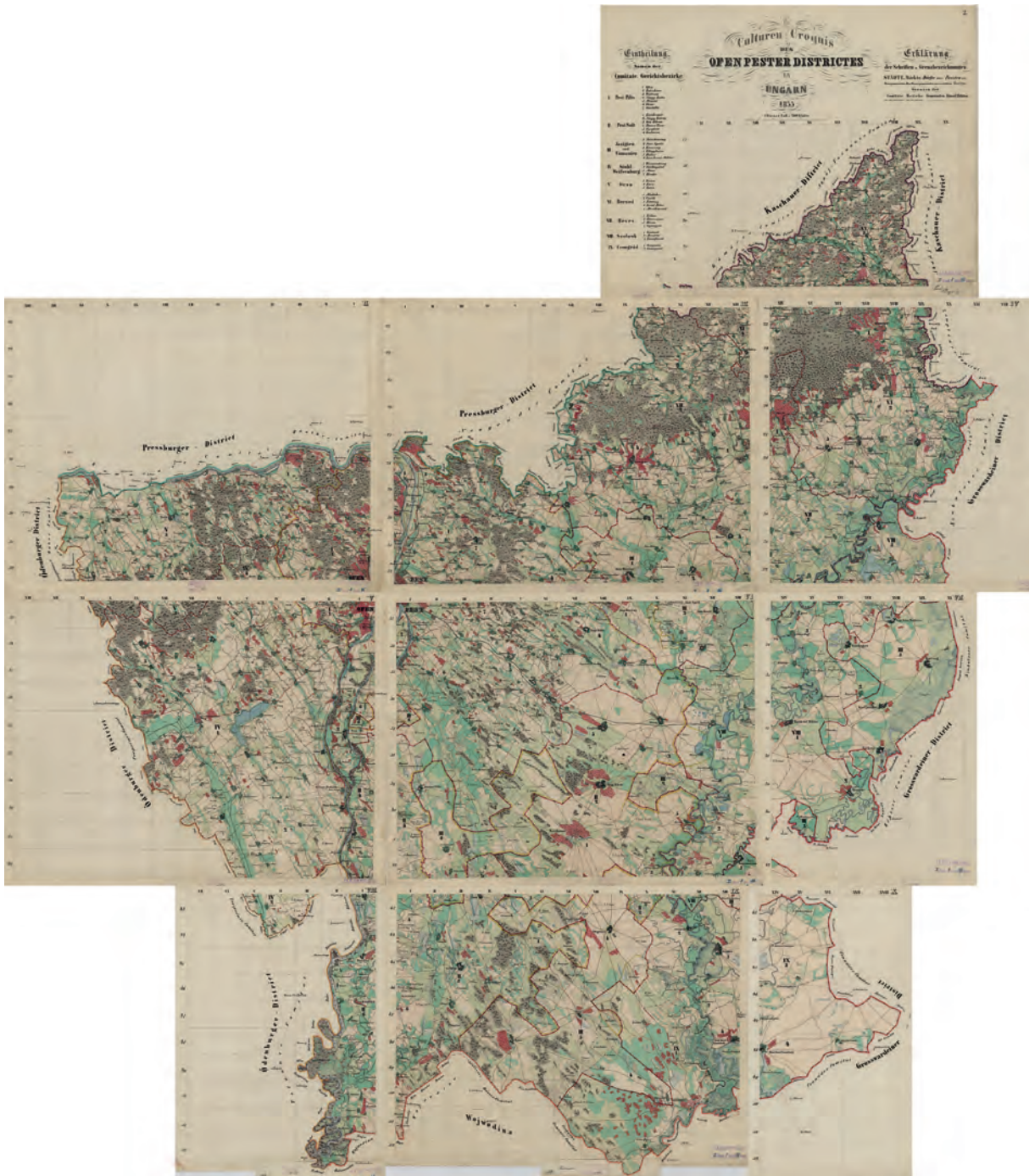
■ A pest-budai adókerület térképe, 1855 (OSZK Térképtár TK 1 904.)