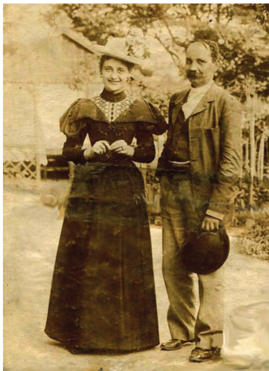
■ ... aki igent mondott!