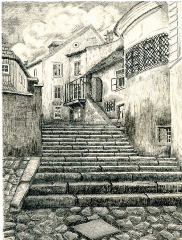
■ Gánóczy Sándor tollrajza. Pozsony, Petőfi-lépcső (1936. április)