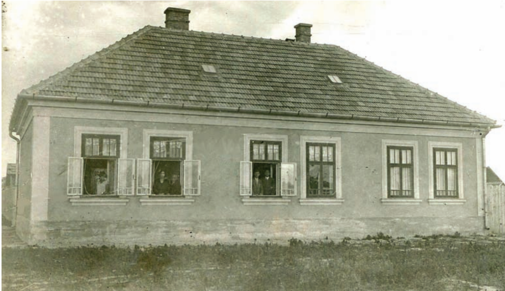
■ Pozsonypüspöki, Vasút utca 27.

felügyelőként dolgozott összesen 11 év, 9 hó, 17 napot. 16 Mindvégig a IX. főosztály állandó katasztert irányító ügyosztályán tevékenykedett. 17 Budapesten 1901 után Újpesten, a Deák utca 39-ben lett háztulajdonos, itt élt egészen addig, amíg Pozsonyba nem helyezték. 18