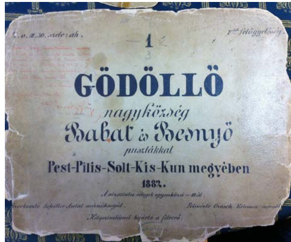
■ Gödöllő kataszteri birtokvázlata, címlap