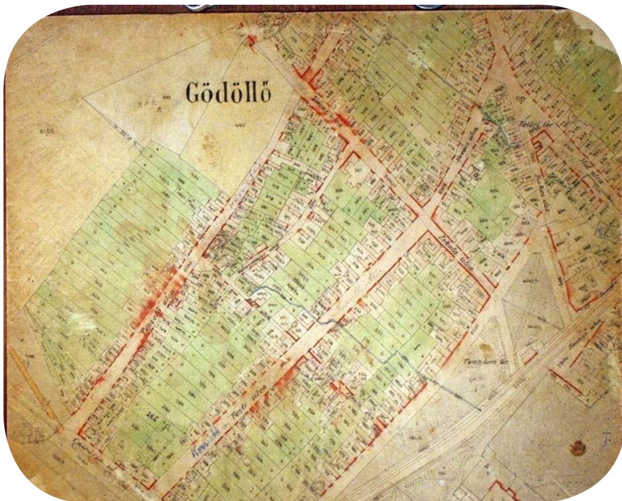
■ Gödöllő birtokvázlata, 12. szelvény jobb alsó negyedlap. A Templom tér (ma Szabadság tér) 1970-es években elbontott házsorával, a jobb alsó sarokban a kastély negyedlapon lévő szárnyaival.

ismérveit nélkülöző munkákban megjelent adatok, a településhez kapcsolódó legendák valóságtartalma is meghatározhatóvá válik.