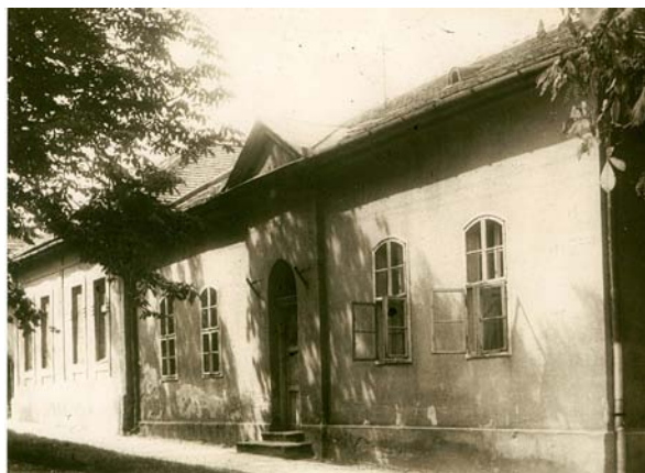
■ Szabadság tér, katolikus iskola, 1970-es évek (épült 1879-ben), ma Szent Imre Általános Iskola

A kataszteri felmérések során keletkezett iratok a településtörténeti kutatásokban jelentős szerepet tölthetnek be, különösen egy-egy forráshiányos időszak vizsgálatakor. 26 Gödöllő kataszteri felmérését csupán a birtokvázlat és a kataszteri térkép őrzi. A 33 szelvényből álló, szintén 1882-ben készült kataszteri tér-