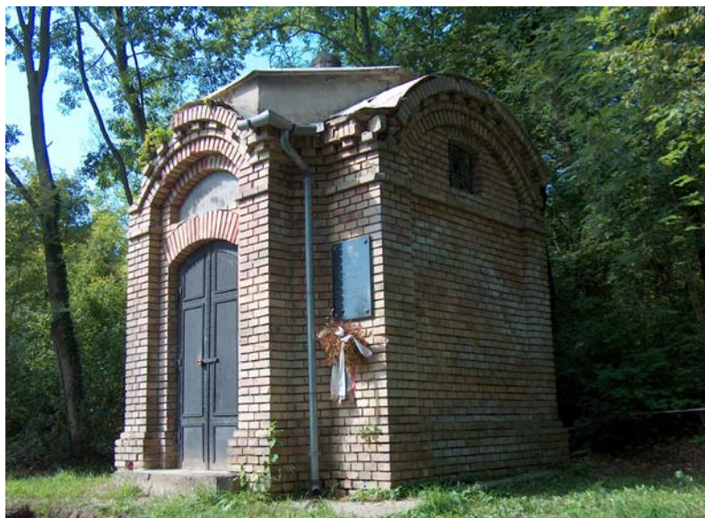
■ Ivánka Imre kriptája a máriabesnyői temetőben