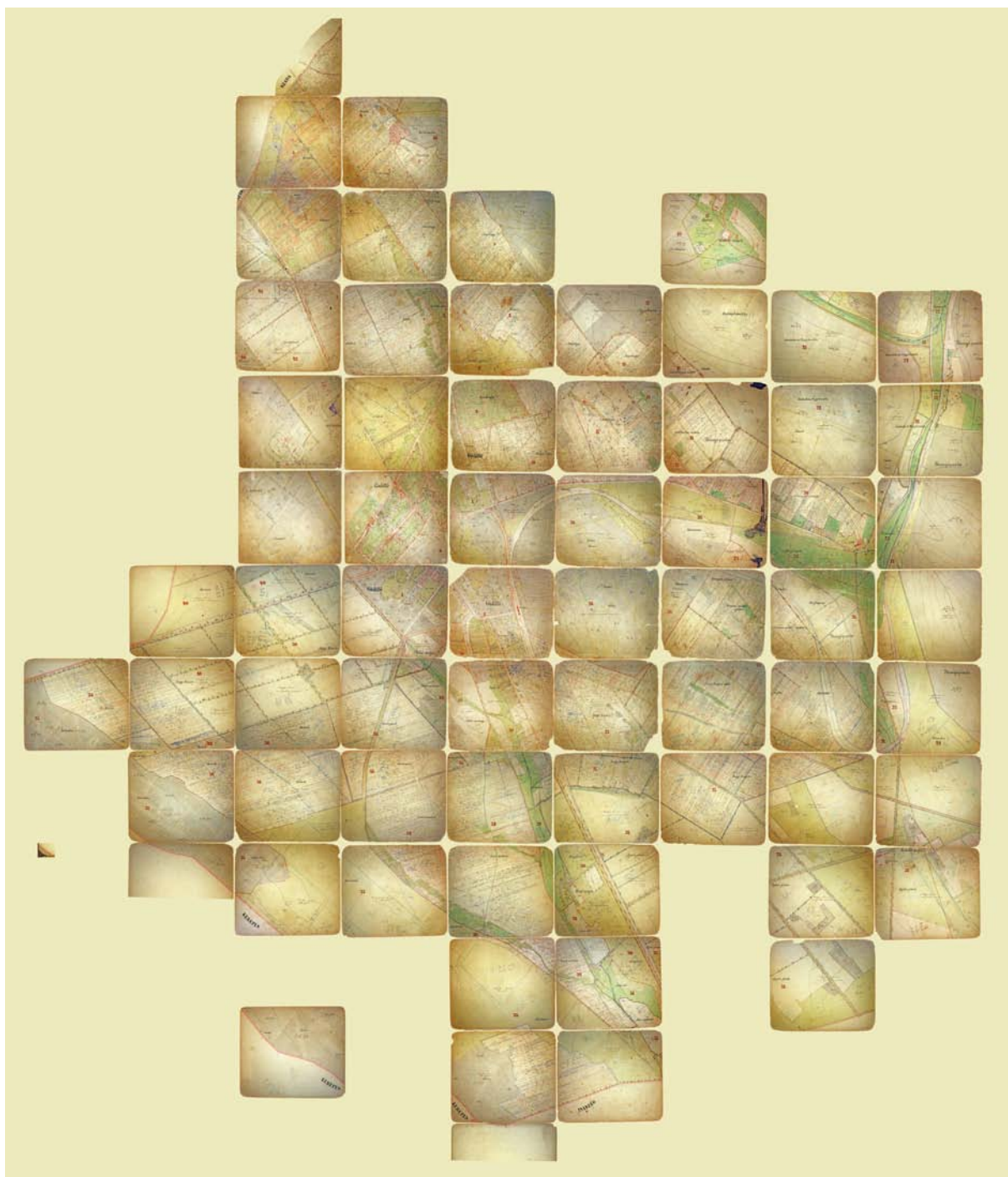
■ A birtokvázlat fennmaradt szelvényei összeillesztve

csak következtetni lehet. A kék tintával készült bejegyzések feltehetően még a 19. században keletkeztek. 22 A többi a második világháború utáni időszakból származik. Mely intézmény és pontosan milyen célból vezette az adatokat a térképre? A rendelkezésre álló