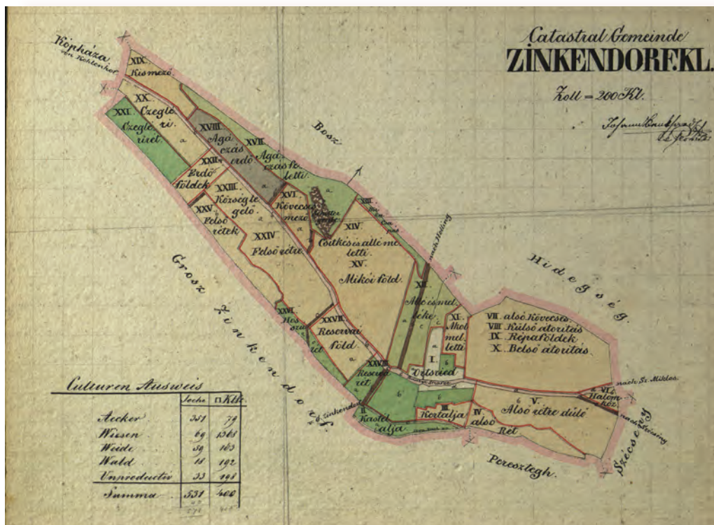
■ Kiscenk 1 : 14 400 méretarányú térképvázlata (1854) – MNL OL, S 78 Sopron m. Kiscenk 1–2.